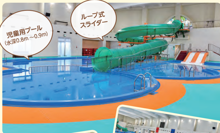
児童用プール (水深0.8m~0.9m)

全長38.4mのループ式スライダーをはじめ、幼児用、児童用、25mプールなど、多様な利用に対応したプールをご用意しています。