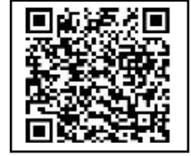
↑ 大人水泳教室申込QRコード

キャンセルがあった場合に限り、キャンセル待ち該当者にご連絡をいたします。 キャンセル待ちの順番は、抽選により決定させていただきます。