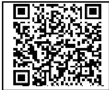
↑ 子供水泳教室申込QRコード